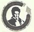
Plantel 6 Vicente Guerrero